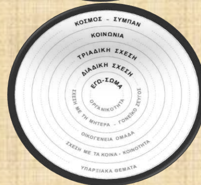
Δραμ/θεραπευτικό παράδειγμα με χρήση του μύθου